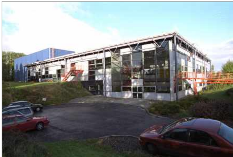
<リチャード・ロジャース設計の本社屋>

創業の翌年にはスピーカーシステムを発表。その後、エレクトロニクスも自社開発・生産可能な体制を整備し、独善的に陥らないオリジナルな発想とホームユースで最良の結果、すなわち優れた音質とユーザビリティを実現する製品群をリリース。先進的な技術力を背景に、Hi-Fi 業界はもとより豊かなライフスタイルを追求する世界中の人々から注目を集める存在になっています。