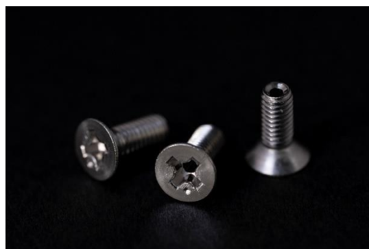
Figure 7 中空穴付きネジ (M3 皿ネジ)

現行 Crystal E のそれは Ni メッキ仕様のスチール製 M3 皿ネジでしたが、チューニングにおいて再吟味され、M3 皿ネジによって密閉されていた Crystal E 内部に対し、ステンレス製中空穴付きの M3 皿ネジを採用。内部エア抜きの効果により開放的な音質となっています。