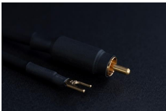
Figure 8 RCA プラグーY 端子

ひとつは「RCA プラグーY 端子」ケーブル。もう一つは「Y 端子ーY 端子」ケーブルです。