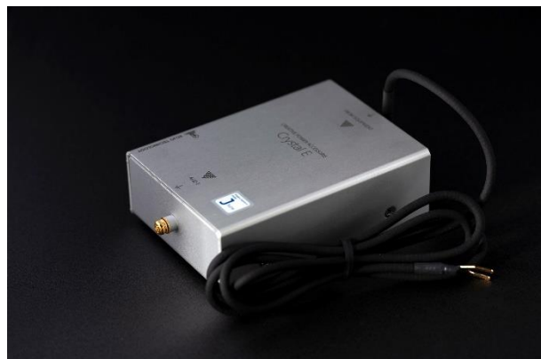
Figure 1 Crystal E Jtune