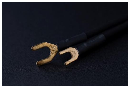
Figure 9 Y 端子ーY 端子