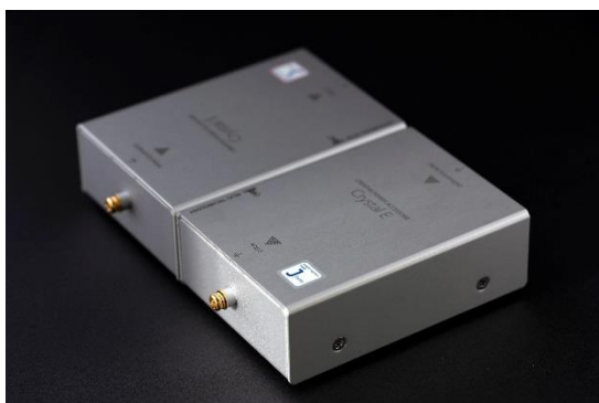
Figure 5 Crystal E Jtune アース端子

※Crystal E Jtune×1 台に対し、オーディオ機器 2 台の接続は多重アースを発生させるため、オーディオ機器×1 台 : Crystal E Jtune×1 台を推奨します。