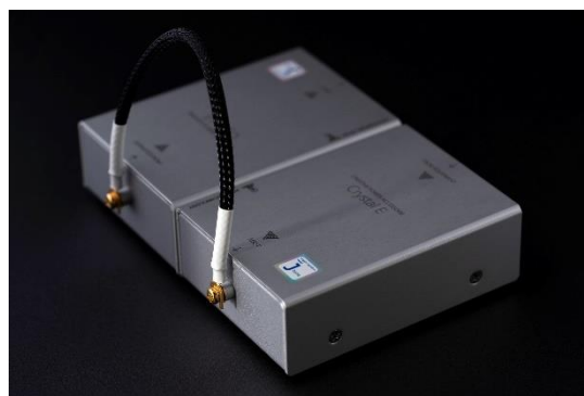
Figure 6 Crystal E Jtune 増設