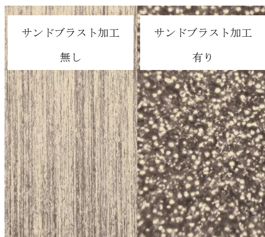
Figure 4 内部異金属プレートの表面

Crystal E Jtune に配備されるアース端子は、現行 Crystal E のステンレス製 M4 バインドネジから、金メッキ M4 の 3 点鍋ネジに変更されており、より安定した導通性能を引き出しています。また、アース端子は 2 端子設けられていますが、ひとつ（FROM EQUIPMENT）はオーディオ機器との接続に、もう一方（ADD E）は増設用の端子としてお使いいただけます。