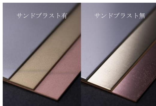
Figure 2 サンドブラスト加工の有無