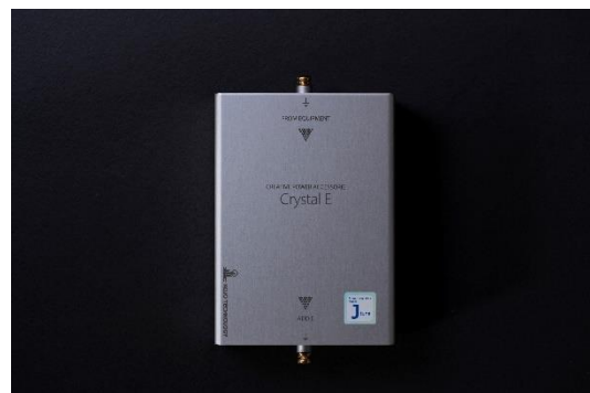
Figure 10 方向性と接続機器の指示表記

シンプルデザインの Crystal E Jtune は、KOJO TECHNOLOGYらしいクリエイティブな電源アクセサリとして、「CREATIVE POWER ACCESSORIE」の称号を得ています。