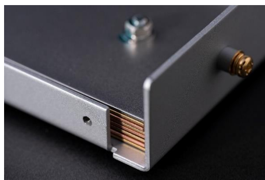
Figure 3 Crystal E Jtune レイヤー構造

Crystal E の内部異金属積層プレートは平滑で凹凸がなく、表面積は約 1,000\text{cm}^2 ( 30\text{cm} \times 33.3\text{cm} ) ですが、本限定モデルはサンドブラスト加工による凹凸処理によって、有効面積が 60%アップ！約 1,600\text{cm}^2 ( 30\text{cm} \times 53.3\text{cm} ) にまで拡大されています。